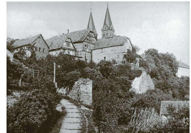
Ziegenberg um 1900