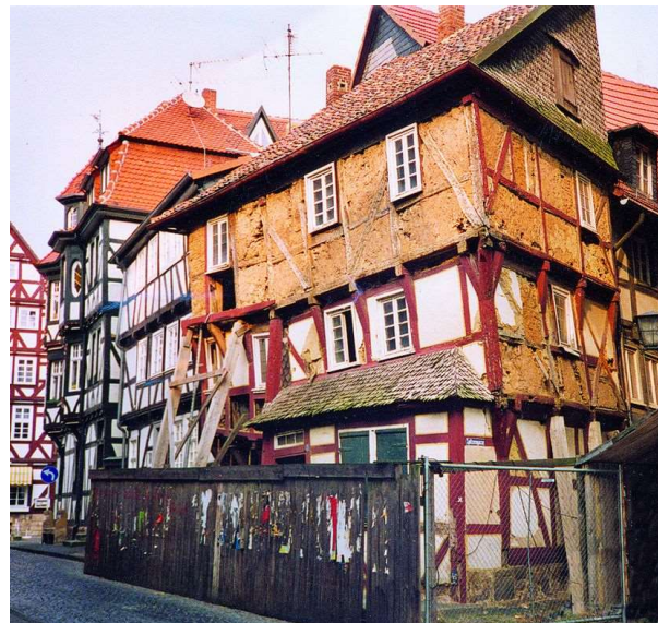
Spitzenhäuschen (ehem. Villa Haas, um 1985)